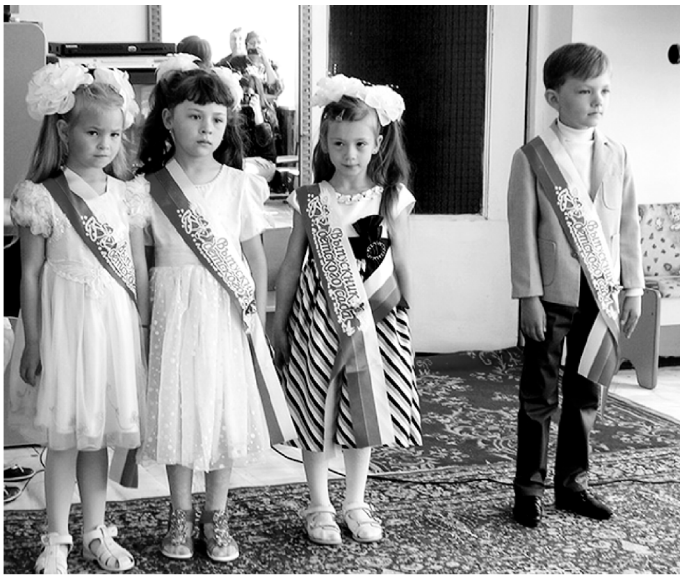
Детский сад «Сказка» в д. Вязовна, как всегда, порадовал прекрасным проведением мероприятия. Украшенный зал, взволнованные родители, несколько растеря-

В детских садах начались выпускные. Не экзамены, конечно, а «последний звонок» для тех детишек, которые в сентябре пойдут в школу. Первый этап на пути взросления пройден. Радостно и страшно, и родители волнуются, украдкой утирают слезы: как быстро выросли их малыши!